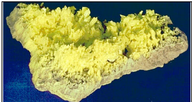
Soufre de fumeroles volcaniques, Vulcano, Italie

À proximité des exhalaisons gazeuses qui s'échappent de fissures des volcans (les fumerolles), on trouve toute une série de minéraux qui se sont formés par sublimation (passage direct de l'état gazeux à l'état solide). Beaucoup de ces minéraux sont délicats, fragiles, souvent facilement solubles dans l'eau. Le plus typique d'entre eux est le soufre natif.