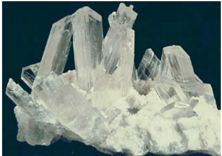
Gypse. CaSO 4 San Antonio, Mexique