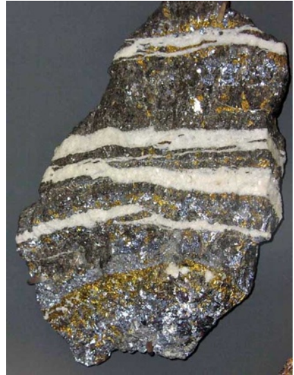
Filon hydrothermal avec blende, galène, chalcopryrite et quartz

Après la formation des pegmatites, les liquides restants - qui renferment encore de nombreux éléments dissous s'accumulent sous forme de solutions hydrothermales . Ce sont des solutions aqueuses très chaudes (plusieurs centaines de degrés) qui, sous l'effet d'une pression élevée, s'infiltrèrent dans les fractures des roches encaissantes. Leur pression et leur température diminuent au fur et à mesure qu'elles se rapprochent de la surface de la croûte terrestre. Elles déposent sur les parois des fissures une succession de minéraux qui constituent les filons hydrothermaux . La température de formation des minéraux décroît donc au fur et à mesure qu'on s'éloigne du massif magmatique originel.