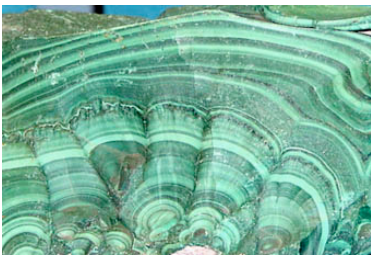
Malachite, Rép. du Congo