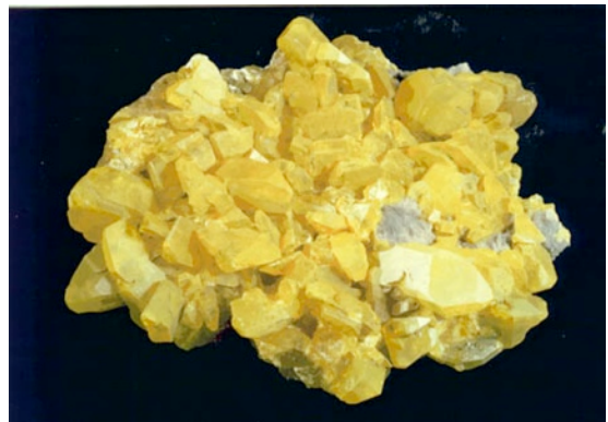
Soufre natif, Sicile

Divers minéraux peuvent se former dans les roches sédimentaires par des mécanismes chimiques ou biologiques complexes. On peut trouver dans ces conditions la pyrite , la marcassite , l' hématite , la calcédoine et le soufre natif .