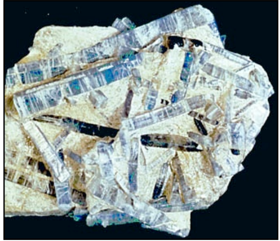
Disthène et staurotide, Pizzo Forno, Suisse

Lorsqu'une roche est soumise à une augmentation de pression et de température, au contact d'une intrusion magmatique ou à la suite d'un enfouissement profond sous d'autres roches, elle subit une métamorphose - que les géologues appellent métamorphisme - qui fait apparaître un nouvel assemblage minéralogique au détriment de celui qui existait auparavant. On pourrait comparer sommairement ce mécanisme à la cuisson d'un biscuit: l'aspect de la pâte n'est plus le même après la cuisson qu'avant son entrée dans le four! Les roches métamorphiques les plus courantes sont les gneiss, les schistes. Parmi les minéraux les plus typiques, citons le talc, l' épidote , l' actinote , les grenats , le disthène , la staurotide .