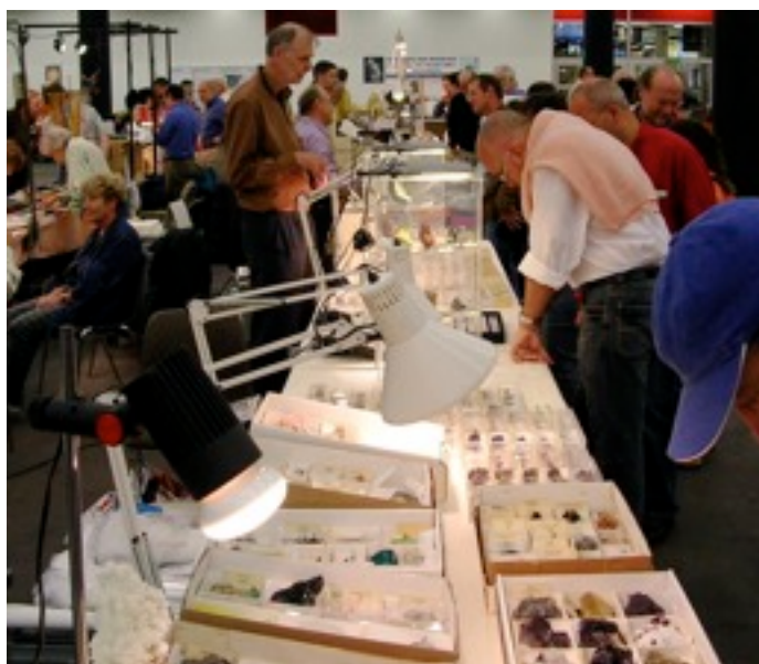
Bourse aux minéraux, Genève, octobre 2006.

On peut aussi devenir membre d'un club d'amateurs de minéraux et participer aux excursions qu'il organise sur des gisements connus. Malheureusement la plupart des sites connus ont été déjà longuement fouillés et les trouvailles intéressantes restent rares.