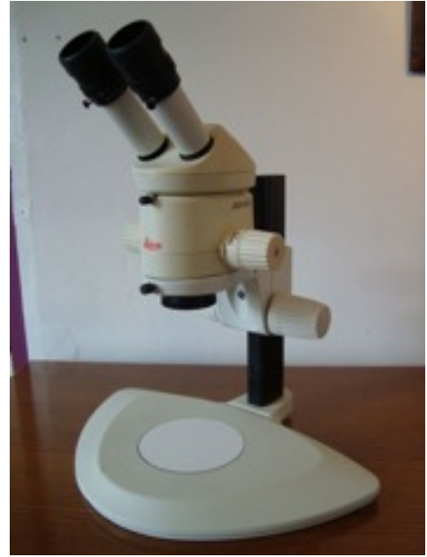
binoculaire L o u p e