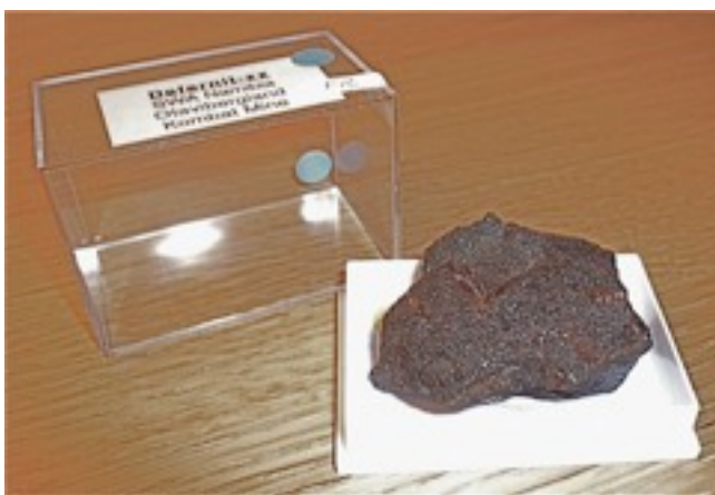
Minéral dans sa boîte